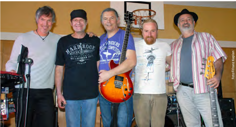
Auch „Blue Electric Eagle“ stellten sich in den Dienst der guten Sache.