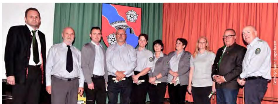
Angelobung neuer Berg- und Naturwachtmitglieder im Kulturhaus Ilz.

Bezirksstelle Hartberg-Fürstenfeld begrüßen. Im Rahmen der Veranstaltung wurden sechs neue Mitglieder angelobt und 18 langjährige Mitglieder geehrt. Die Berg- und Naturwacht ist eine Körperschaft öffentlichen Rechts mit Bezirksleitungen, Ortseinsatzstellen und Aufsichtsorganen zum Schutz des natürlichen Lebensraums von Menschen, Tieren und Pflanzen. Zu den wichtigsten Aufgaben zählen die Pflege von Schutzgebieten, um die Biodiversität zu erhalten. Regelmäßige Kontrollgänge zur Überwachung der Naturlandschaften dienen dem Schutz vor schädigenden Eingriffen in die Natur.