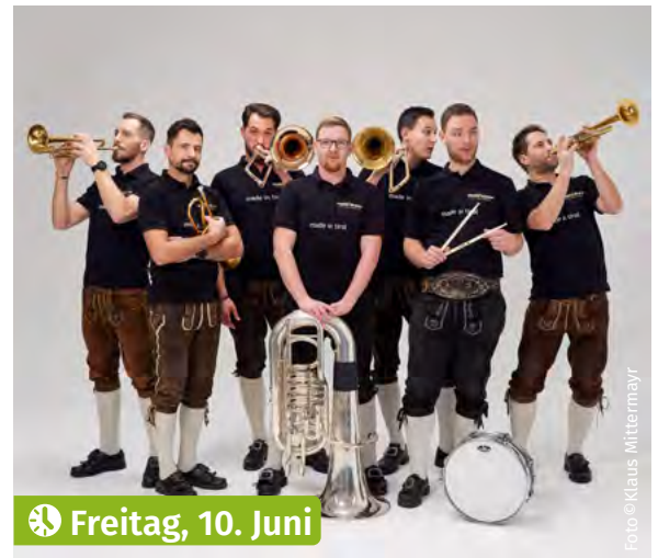
Freitag, 10. Juni