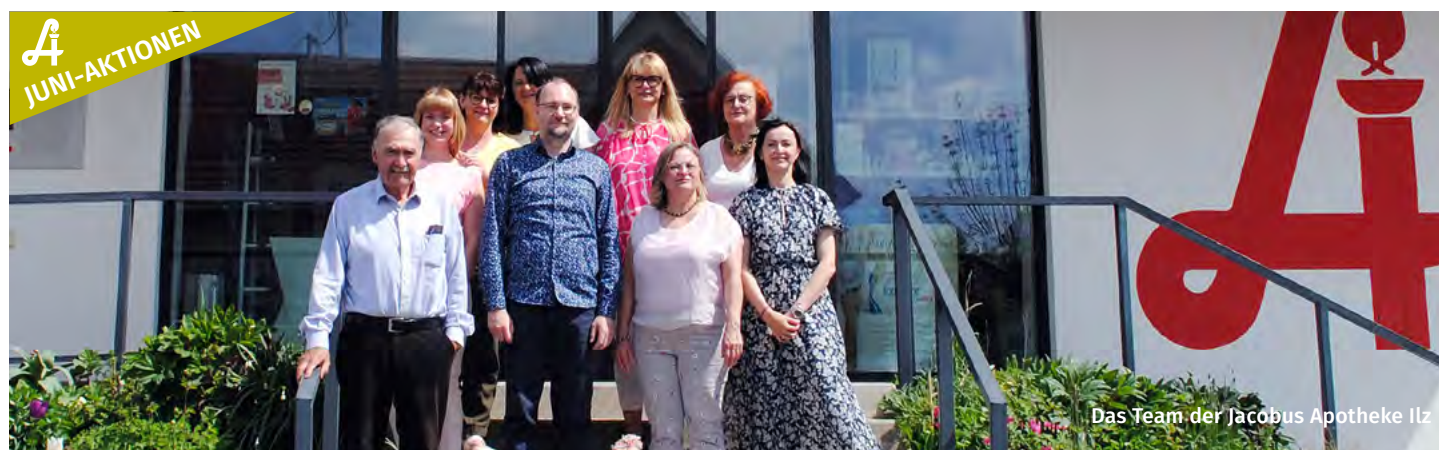
Das Team der Jacobus Apotheke Ilz