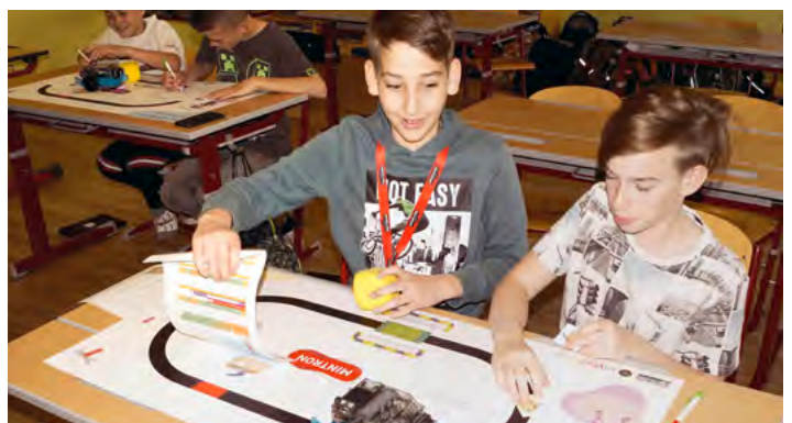
Die Schüler konnten an den Stationen selbst experimentieren.

Nach der Bühnenshow ging es für die Kids an den vier „MINT-Mach-Stationen“ zur Sache. Professionell unterstützt von den Roboterfiguren wurde vieles ausprobiert. Die Jugendlichen erlebten spielerisch am „coolsten Schultag des Jahres“, wie spannend Mathematik, Informatik, Naturwissenschaft und Technik sind.