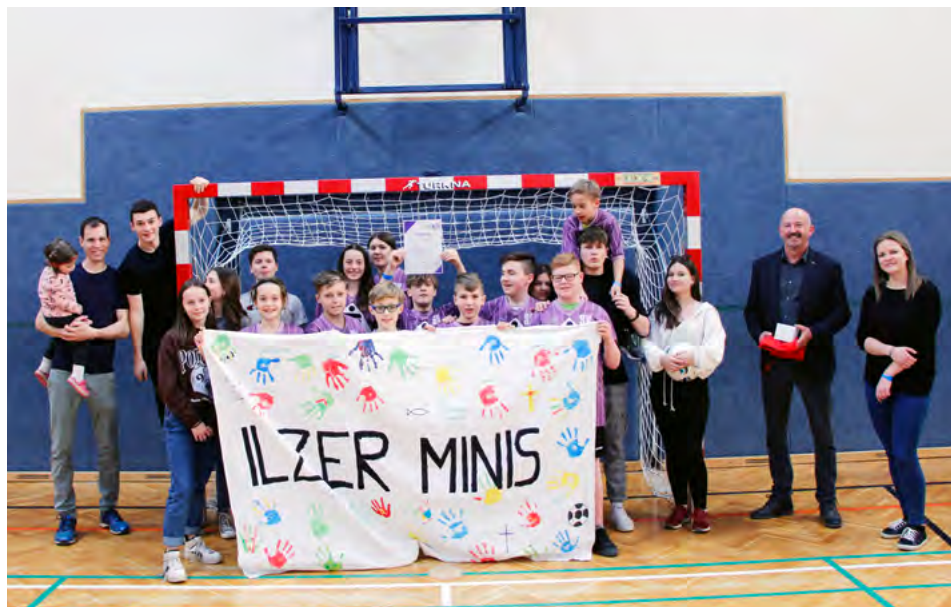
Die Ilzer Minis nahmen ebenfalls am Turnier teil.