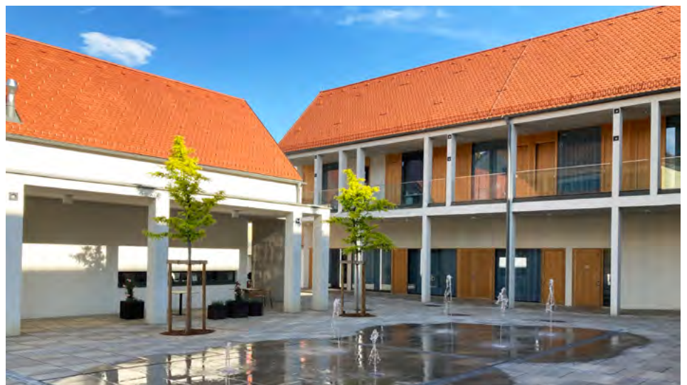
Neue 1. Adresse: Ilzer „Marktplatz“ mit Gemeinde- und Trauungssaal.

Projekte: Tilgung Zentrum, Grundstücksankäufe, Kanalbau, Sportanlage Nestelbach, Einsatzfahrzeuge FF Ilz & FF Hohenegg