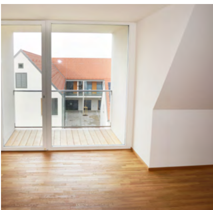
Komfortable und moderne Wohnungen im Haupthaus des Zentrums am Hauptplatz.

Nähere Auskünfte erteilt Markus Wallner vom Marktgemeindeamt Ilz: T: 03385/377-231, E: wallner@ilz.gv.at. Informationen zu freien Immobilien, Grundstücken und Gewerbeflächen in der Marktgemeinde Ilz sind auch unter www.ilz.gv.at/wohnungen-hauser-grundstuecke-und-geschäftslokale zu finden.