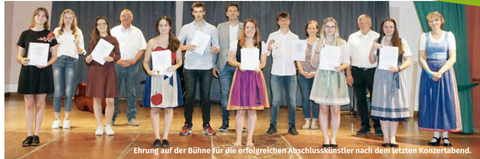
Ehrung auf der Bühne für die erfolgreichen Abschlusskünstler nach dem letzten Konzertabend.