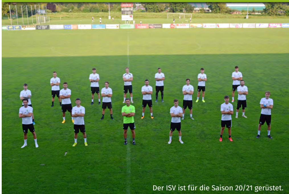
Der ISV ist für die Saison 20/21 gerüstet.