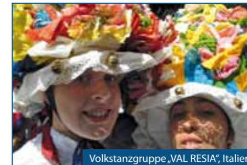
Volkstanzgruppe „VAL RESIA“, Italien

Tatsächlich erlebt man im Resia Tal die Musik und den Tanz der ganzen Gemeinschaft der sogenannten „Resianer“ bei vielen Gelegenheiten im Laufe des Jahres: während des traditionellen püst / der Fasching im Resia Tal, bei Dorffesten, Einberufungen oder bei Hochzeiten tanzen die Leute und überliefern damit die alte Tradition von Generation zu Generation.