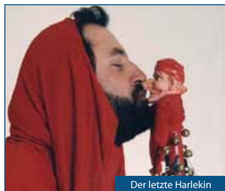
Der letzte Harlekin