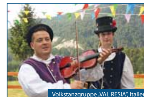
Volkstanzgruppe „VAL RESIA“, Italien

MOST brunner Qualitätsmost - Jause - Kaffee - Mehlspeispezialitäten A-8262 Ilz - Dambach 13 Telefon 03385 / 586 www.mostschenke.com www.steiermost.at