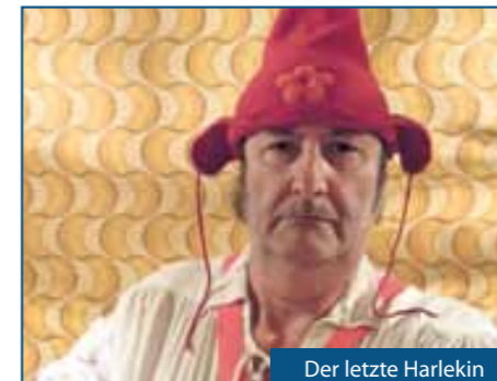
Der letzte Harlekin

Ganztätig AUTODROM BUNGEE-TRAMPOLIN OLDTIMER FAHRZEUGE