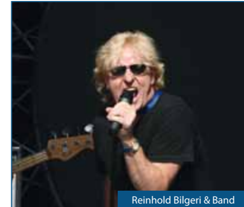
Reinhold Bilgeri & Band

Jetzt ist Bilgeri wieder auf die Rockbühne zurückgekehrt und tourt mit seiner Band durch Österreich. Sein Programm ist gespickt mit den Topsongs seiner langen Karriere, Hits aus vier Jahrzehnten – von „Video Life“ bis „Some girls are Ladies“, von „Deperado“ bis „Oho Vorarlberg“.