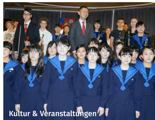
Kultur & Veranstaltungen