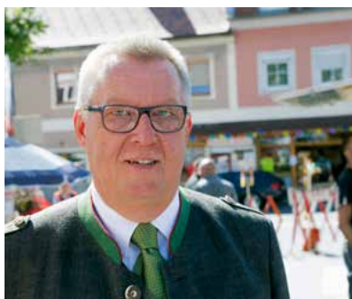
Bürgermeister Rupert Fleischhacker