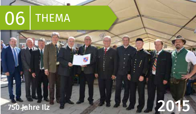
750 Jahre Ilz