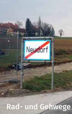
Rad- und Gehwege