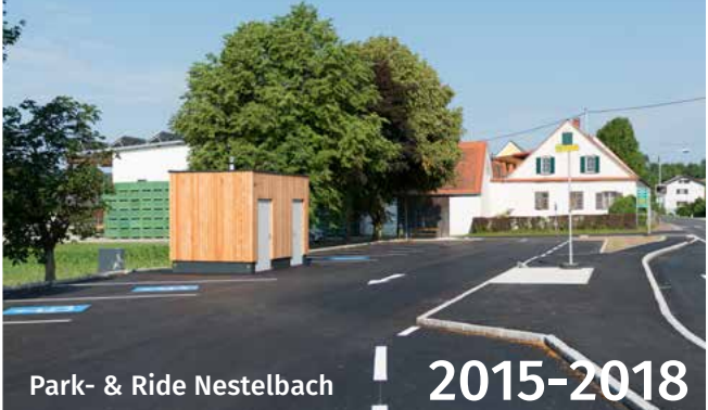
Park- & Ride Nestelbach