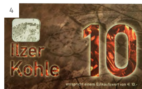
Bericht: Bernd Baronigg [Foto 4]: Ilzer Kohle

Einzulösen bis 30. April 2020 gegen Abgabe der ILZER KOHLE mit einer der genannten Seriennummern in den angeführten Ilzer Kohle Betrieben.