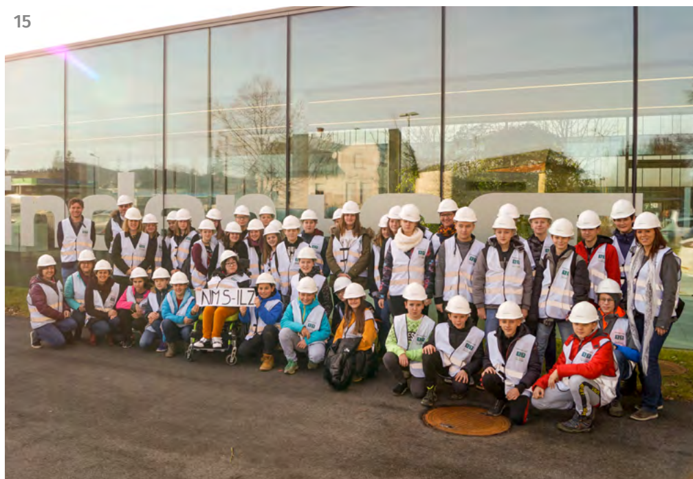
[Foto 14]: Aufmerksame Zuhörer beim Workshop [Foto 15]: Betriebsbesuch bei Binder&Co in Gleisdorf

Dieses einzigartige Unternehmen in der Aufbereitung von Schüttgütern in Gleisdorf, lernten unsere Teenies am 13. Februar kennen. Sie wurden kompetent durch die Firma geführt und staunten darüber, welche Einzelsysteme und Aufbereitungsanlagen hier für Bergbau und Recyclingindustrie entwickelt, gebaut und verkauft werden. Den achtsamen Umgang mit wertvollen Rohstoffen, die Mission der Firma, werden sicherlich alle auf ihrem Lebens- und Berufsweg mitnehmen. Der Betrieb hofft, möglichst viele aus der NMS Ilz als Lehrlinge wiederzusehen.